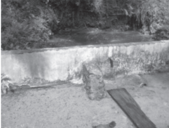
Situs berasal dari abad awal

Salah satu informasi yang memberikan referensi akan tempat ini adalah tulisan Abû bâlih dari Armenia yang diselesaikannya tahun 1054.